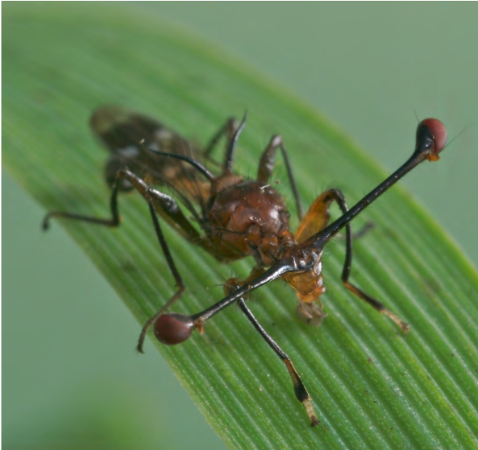
↑ Figura 1. Foto d'un mascle de la mosca amb ulls de peduncle Teleopsis dalmanni , sinònim de Cyrtodiopsis dalmanni . Autor: Rob Knell. Font: Viquipèdia.