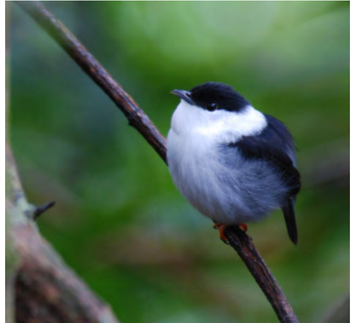
↑ Figura 2. Foto d'un mascle de manaquí barbat blanc ( Manacus manacus ) en el seu lek, a Asa Wright Center, Trinidad.

inadaptat (per exemple, una ornamentació masculina exagerada que dificulta la supervivència), perquè una freqüència creixent de femelles durant generacions s'aparellen amb aquests mascles que tenen els ornaments. Potser la demostració més convincent de la selecció desfermada la va proporcionar el treball de Wilkinson (1993) amb la mosca amb ulls amb peduncle Cyrtodiopsis dalmanni (Figura 1). Les mosques amb ulls amb peduncle són insectes estranys amb els ulls situats al final d'unes estructures llargues (peduncles oculars) que es projecten des dels dos costats del cap. Després de seleccionar artificialment els mascles amb peduncles oculars llargs o curts, va trobar una associació positiva entre la longitud dels peduncles oculars masculins i la preferència femenina per aquest tret; és a dir, les preferències femenines van canviar com a resposta correlacionada per a la selecció de la longitud del peduncle ocular masculí.